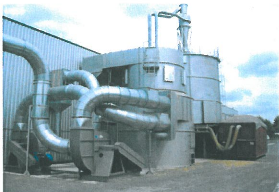
Aspiration des copeaux

L'hiver, renvoi d'air chaud en atelier après filtrage , l'été à l'extérieur Envoi de copeaux dans un silo de stockage Si le silo est plein, les copeaux sont détournés dans la benne rouge et serviront à faire des panneaux de particules