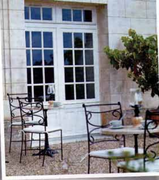
Fenêtre ou porte-fenêtre, style traditionnel ou moderne... les menuiseries bois se plient à toutes les envies.